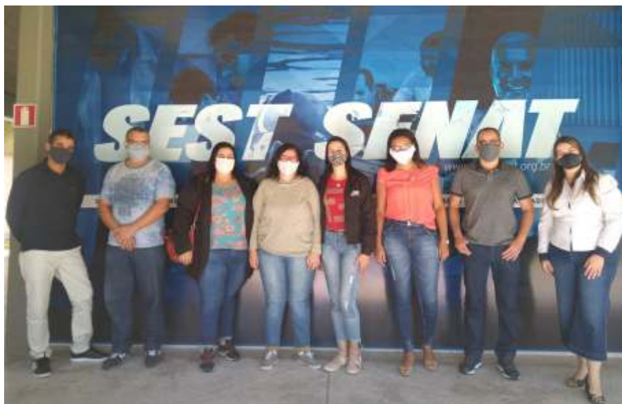
Na foto, os empresários e colaboradores presentes na turma do Curso de Oratória, devidamente protegidos.

No segundo semestre de 2020, o SETCJF, reafirmando seu papel junto no crescimento e na valorização de suas associadas, montou uma turma do Curso de Oratória do SEST SENAT em Juiz de Fora.