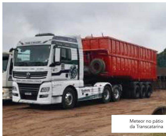
Meteor no pátio da Transcatarina

“ A bordo do VW Meteor 28480 temos uma condução suave com excelente desempenho. Quando necessário, ele entrega muita potência em subidas, ultrapassagens seguras e retomadas de velocidade. Seu interior conta com uma geladeira, kit multimídia e excelente espaço interno, maleiros bem distribuídos e espaçosos. Com relação ao consumo, excelente custo benefício e muito econômico ”, relatou o Gerente.