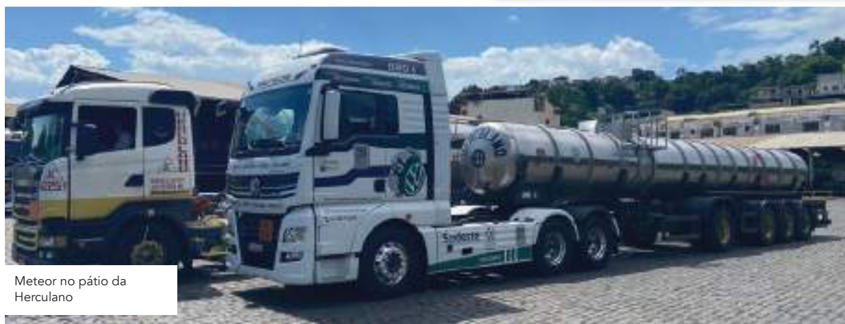
Meteor no pátio da Herculano

ESQUEÇA TUDO QUE VOCÊ JÁ OUVIU FALAR SOBRE CÂMERAS!